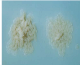
Foto N° 2 : Colonias obtenidas a partir del cultivo en el medio de cultivo Löwenstein Jensen de las muestras analizadas. En todos los casos se obtuvo el aislamiento de colonias rugosas no pigmentadas de crecimiento lento, posteriormente identificadas como Mycobacterium tuberculosis , la codificación de los cultivos osciló entre 7-9.